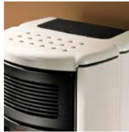
POIVRE-ET-SEL SALZ UND PFEFFER